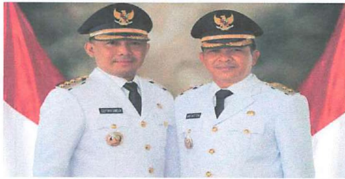
Bupati dan Wakil Bupati Barito Selatan Periode 2020-2026